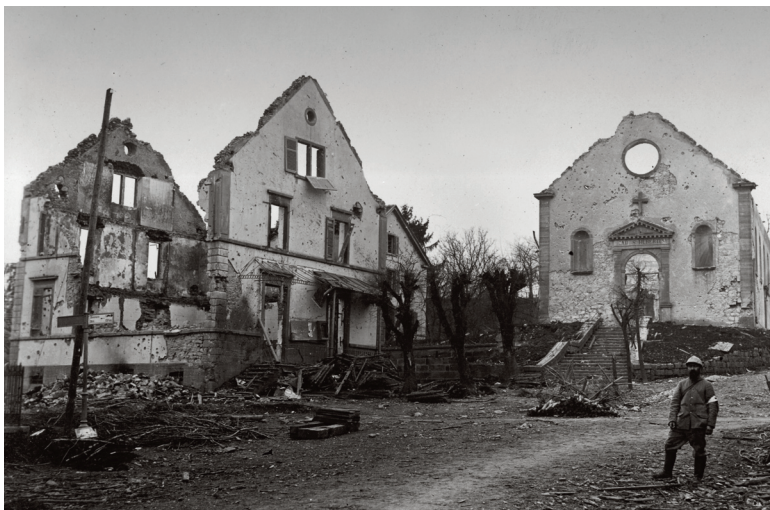
L'église et le presbytère de Seppois-le-Haut ont été lourdement endommagés durant le conflit.