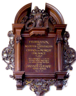
Monument commémoratif dédié aux chanteurs et musiciens catholiques d'Alsace tombés pendant la Grande Guerre.