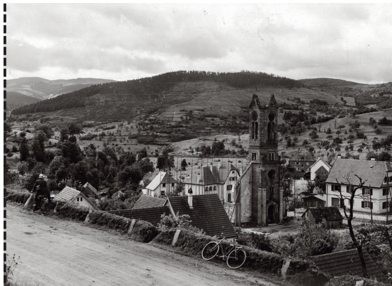
Photographie du chantier de reconstruction du temple protestant de Soultzeren.

EDHISTO - 58 RUE DE LA RÉPUBLIQUE - 88210 SENONES - WWW.EDHISTO.EU